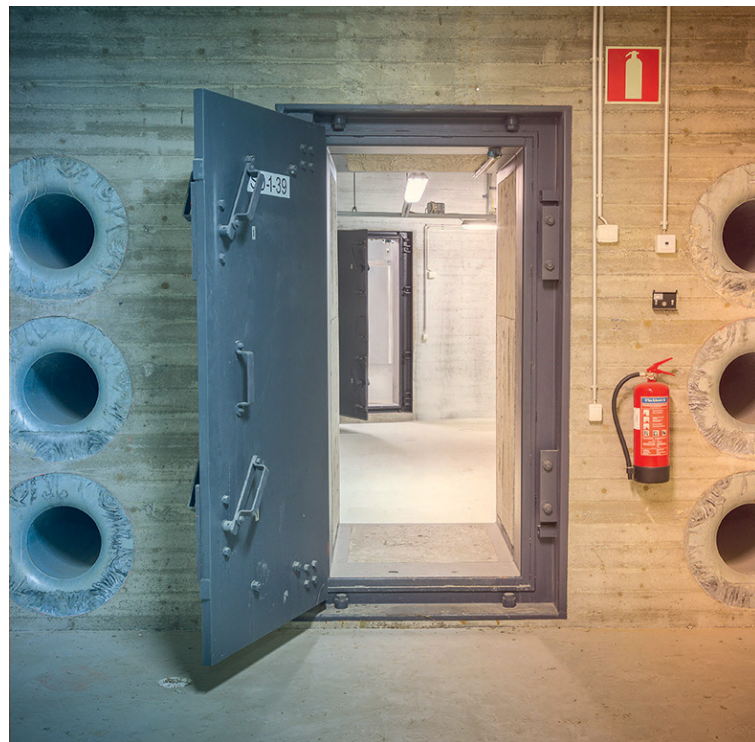
防爆扉と防爆バルブ