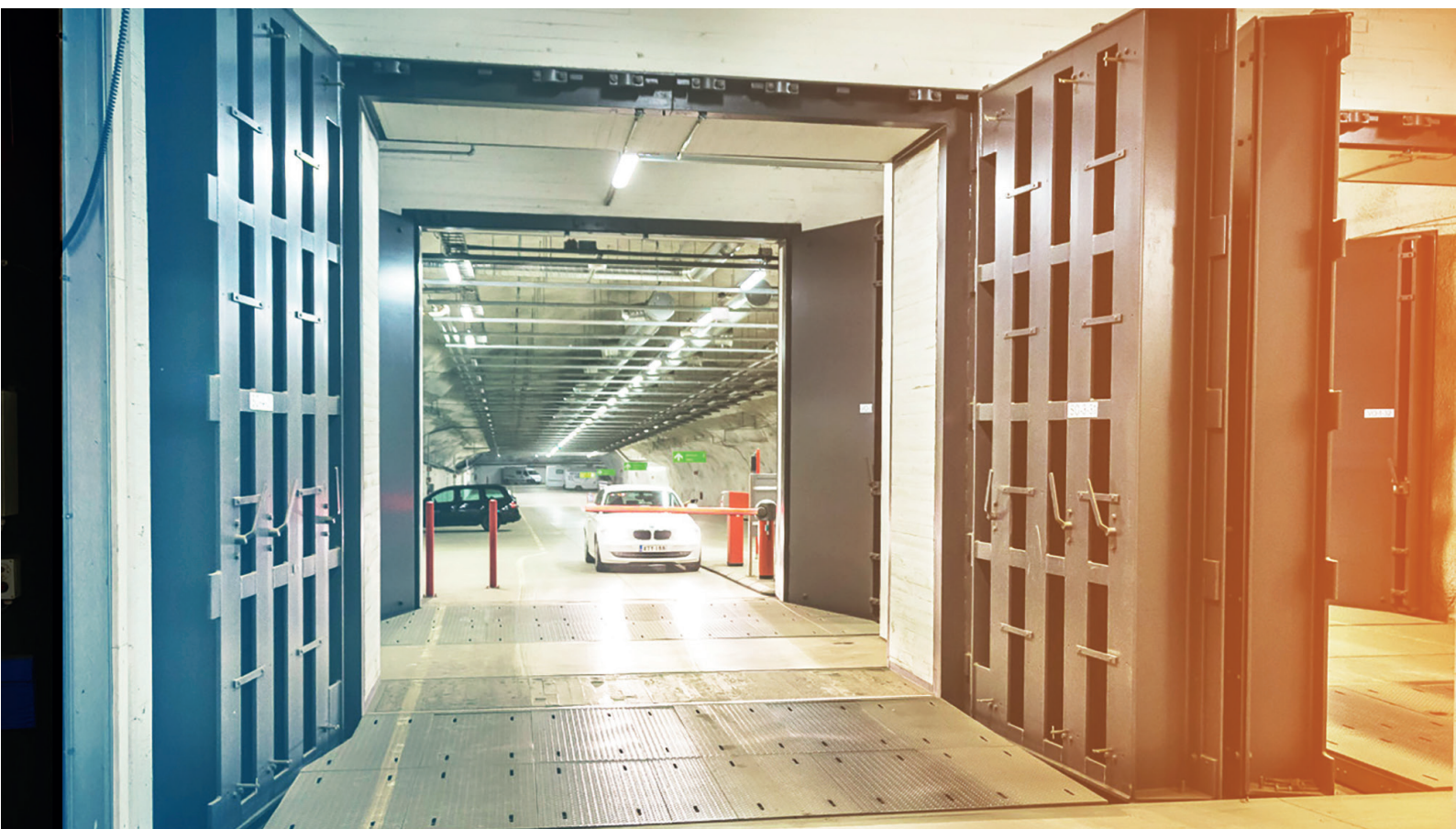
地下停車場入口處的雙扇防爆門

不同類型的掩體在設計和日常使用方面存在顯著差異。最高等級的作戰掩體必須持續處於完全作戰狀態，而普通的公共掩體在常規時間內可以兩用，這意味著在設計階段有更大的靈活性，並在掩體的生命週期內帶來顯著的成本效益。